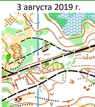
Мостовуха (2019 г) Масштаб 1:10000, Н-2,5м