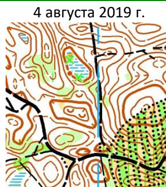
Вороничи(2017-2019 гг.) М 1:10000 (1:15000), Н-2,5м