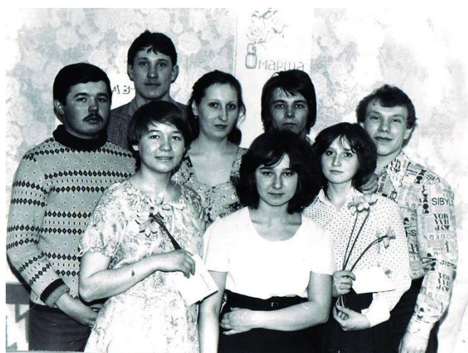
ФОТО-вопрос. Кто это на фото? Всех ли вы знаете?