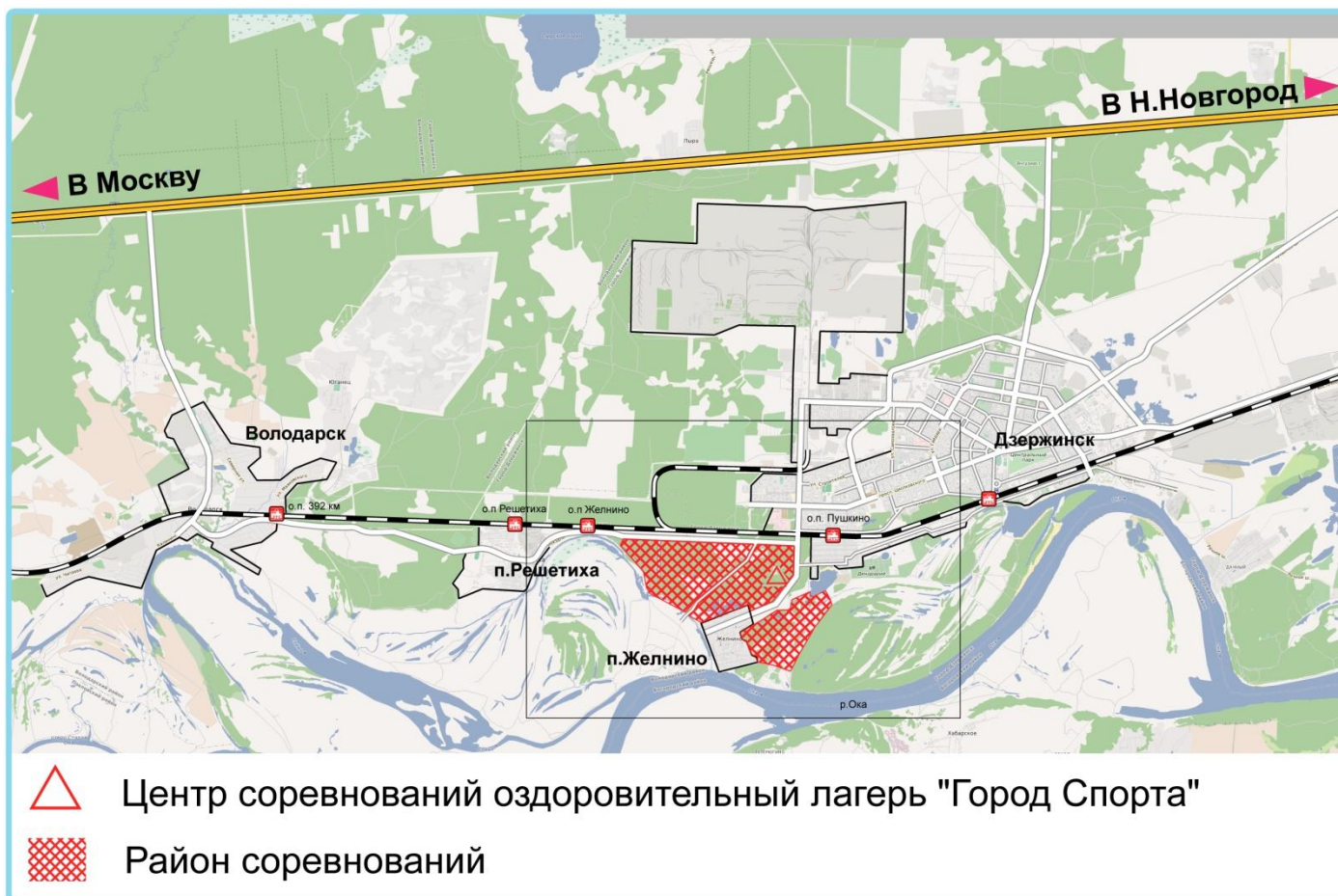
СХЕМА РАЙОНА СОРЕВНОВАНИЙ: